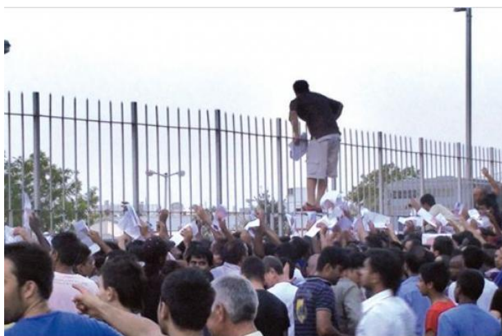
Figure 1 Extrait du documentaire "L'escale"

Depuis les années 2000, des milliers de migrants venus d'Iran, Afghanistan, du Pakistan, d'Algérie, du Maroc arrivent en Grèce, dans le but de rejoindre d'autres pays européens. Lorsqu'ils sont arrêtés, ils sont placés dans des centres de rétention 1 où ils connaissent d'effroyables conditions de vie. En 2013, le nombre de clandestins arrêtés aurait diminué de 44% par rapport à 2012, selon les chiffres du ministère de l'Ordre public, publiés vendredi 13 février.